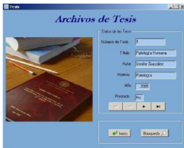
Fig. 5. Vista de un registro de tesis.