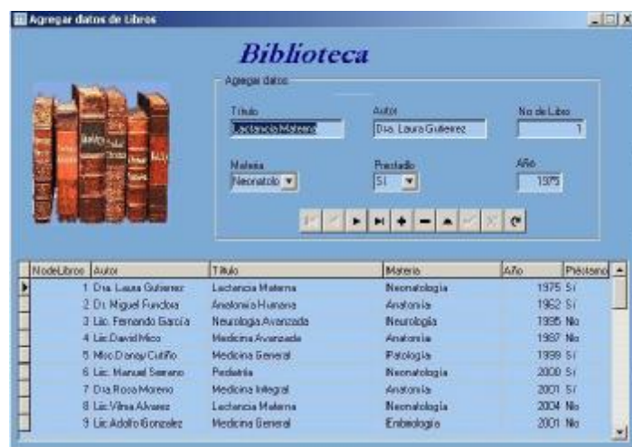
Fig. 4. Pantalla formulario introducción libros.