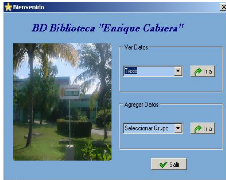
Fig. 3 Pantalla inicio.

("Ver Datos") y la otra para la entrada de datos ("Agregar Datos"), esta última acción solo realizable por el administrador o editor de la base de datos. (Fig.3.) Las figura 4 muestra la pantalla del formulario para la introducción de libros y la figura 5, la vista de un registro de tesis.